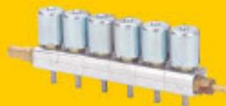
Einspritzbank für 2-, 3-, 4-, 5- und 6-Zylinder-Version erhältlich

Robert-Bosch-Str. 4 · 32547 Bad Oeynhausen Telefon 0 57 31-30 90 56 · Fax 0 57 31-30 75 13 www.e-con-gmbh.de · info@e-con-gmbh.de